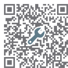
【図面ダウンロード】