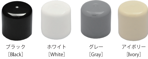
ブラック [Black] ホワイト [White] グレー [Gray] アイボリー [Ivory]