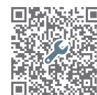
【図面ダウンロード】