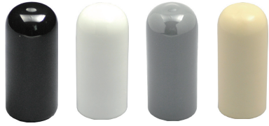
ブラック [Black] ホワイト [White] グレー [Gray] アイボリー [Ivory]