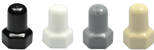
ブラック [Black] ホワイト [White] グレー [Gray] アイボリー [Ivory]