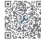
【図面ダウンロード】