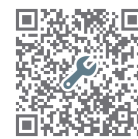
【図面ダウンロード】